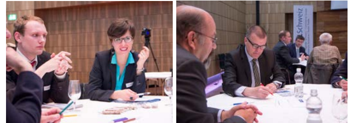
Impressionen World Café 2015